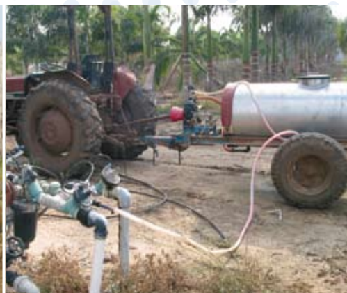
החדרת דשן בלחץ למערכת המים, מהווה סכנה לזרימה חוזרת.

מי השתייה המסופקים במדינת ישראל הינם באיכות טובה מאוד. האיכות נבדקת במקורות המים וברשת האספקה באופן סדיר. עם זאת, איכות המים ברשת האספקה עלולה להיפגע מזרימה חוזרת של מים עם חומרים זרים ולעתים אף רעילים ממפעלים, עסקים ומשקים חקלאיים.