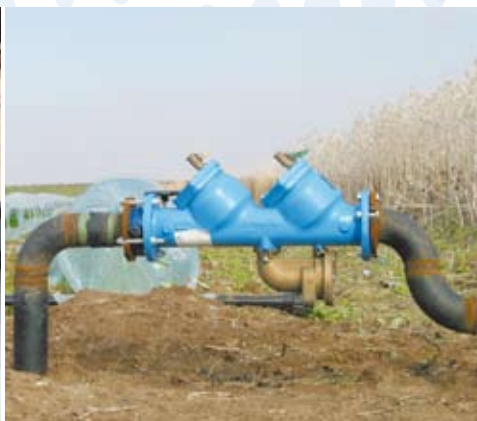
מז"ח מותקן בשטח השקיה חקלאי.