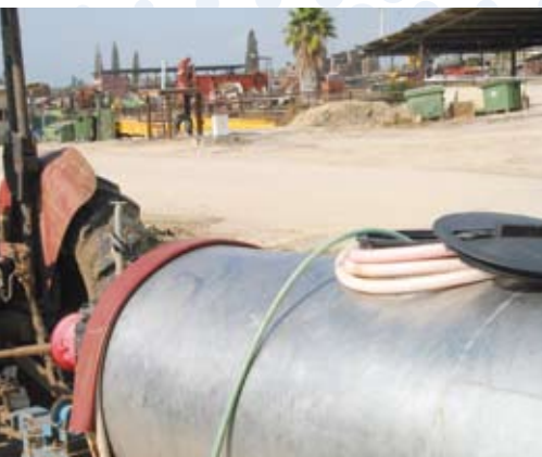
צינור מים גמיש טבול במיכל ריסוס, מהווה סכנה לזרימה חוזרת